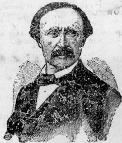
FANCH AN UHEL

Penn-Skrivagner AR BOBL hag AR VRO (Ar Bourc'hiz Iorc'hus ; Pontkallek, Barzaz Taldir)